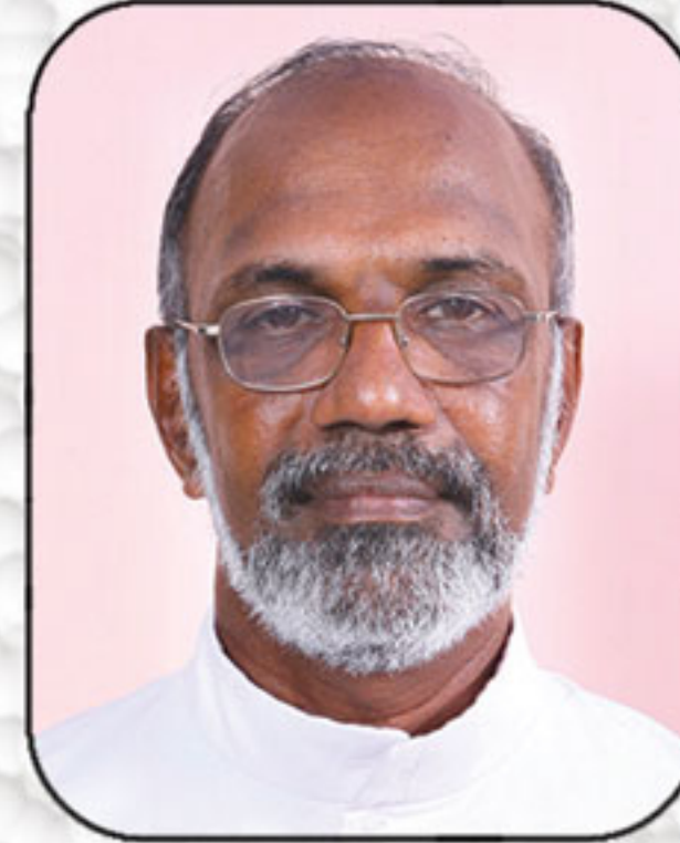
വെരി നവ. ഫാ. മാതൃ ചുരവടി മാനേജർ